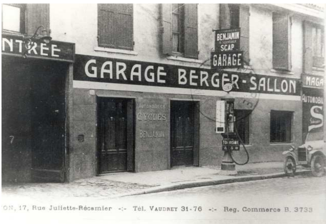
ON, 17, Rue Juliette-Récamière -- Tél. VAUDREY 31-76 -- Reg. Commerce B. 3733

Chaussure confortable, chapeau et bouteille d'eau en période estivale, vêtement chaud en période hivernale.