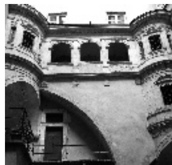
La galerie Philibert Delorme