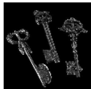
• Les clés de la ville de Lyon, • Chinard, Saulnier, 1805

* À voir... quelque part en ville : les pentes de la Croix-Rousse (1 e arrt.), la rue de la République (2 e arrt.), le parc de la Tête d'Or (6 e arrt.), Fourvière (5 e arrt.)