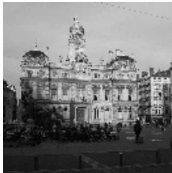
• L'hôtel de ville