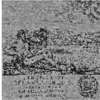
• Perspective de la ville de Lyon, • Israël Silvestre, 1651 (détail)