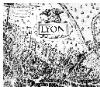
Plan scénographique, 1545 (détail)

* À voir... quelque part en ville* (*patrimoine in situ) : le théâtre de Fourvière (5 e arrt.) ; jardin archéologique de Saint-Jean / église Saint-Etienne (5 e arrt.)