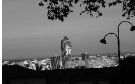
..... La tour de la Part-Dieu