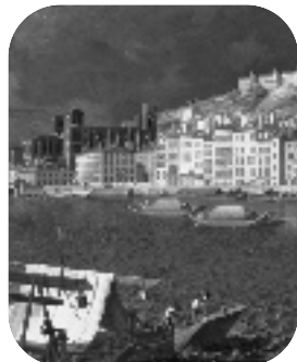
• Bords du Saône à Lyon, • Nivard, 1804 (détail)