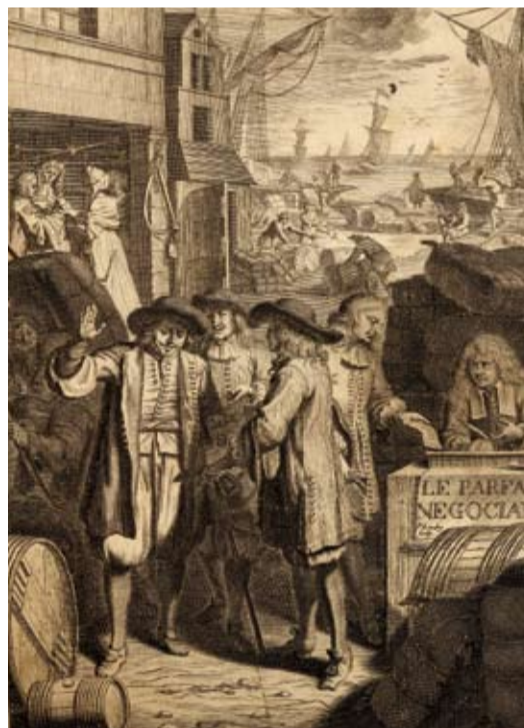
Le parfait négociant , gravure, Pierre Landry, 18 e s., Inv. 1507.3

Par sa situation stratégique sur l'axe Europe du Nord-Orient, Lyon est depuis le 15 e s. un carrefour commercial et financier. Au même niveau que des villes comme Anvers, Augsbourg, Gênes, Florence, Venise ou Lisbonne, elle confirme au 16 e s. son rôle de plaque tournante économique. Y affluent, selon l'expression de l'humaniste Guillaume Parradin, " biens de toutes parts ", " marchandises de toutes les mers " et " commerce de toutes les nations ". Passage obligé entre Paris et l'Italie, elle est en relation continue avec l'Espagne et de plus en plus avec les États du Saint-Empire romain germanique et l'Angleterre. Elle communique régulièrement avec des zones extrêmes comme Narva (actuelle Estonie), Constantinople, Beyrouth ou Séville.