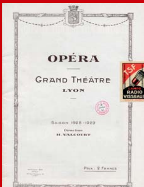
Programme de l'Opéra pour la saison 1928-29

Opéra de Lyon place de la Comédie – 69001 Lyon Tél. : 08 26 30 53 25 | www.opera-lyon.com