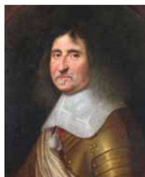
Portrait de Charles 1 er de Neuville de Villeroy, marquis de Villeroy et d'Halincourt, huile sur toile, auteur anonyme, 18 e s., Inv. N 2661