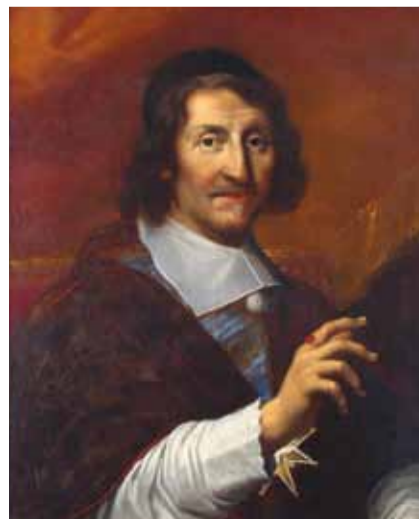
Portrait de Camille de Neuville de Villeroy, huile sur toile, Thomas Blanchet, 2 e moitié du 17 e s., Inv. N 2660

La famille de Neuville de Villeroy s'illustre également dans la carrière religieuse. C'est à l'âge de 5 ans que Camille de Neuville de Villeroy est nommé abbé commendataire d'Ainay, en 1611 ! Ainsi, il perçoit les revenus de l'abbaye, sans toutefois exercer d'autorité sur la discipline intérieure des moines. Il étudie chez les Jésuites puis à Rome, où il devient théologien. En 1618, il est fait abbé de l'Île Barbe, où il s'illustre en reconstruisant l'église détruite par les protestants en 1562. Puis il devient abbé commendataire de Mozac (basse Auvergne) de 1641 à 1655. C'est en remerciement de sa fidélité au roi, en tant que lieutenant général de Louis XIV lors de la Fronde, que la reine lui propose le siège d'archevêque de Lyon, qu'il accepte bien que peu intéressé par la vie ecclésiastique. Sacré en juin 1654, il devient dans le même temps comte de la ville et primat des Gaules*. Partisan de la réforme catholique, il entreprend de réinstaurer la discipline dans le clergé régulier et séculier du diocèse, privilégiant toujours la négociation à la contrainte. À Lyon, il favorise aussi l'installation de nouveaux ordres religieux et aide au développement des couvents, féminins notamment. Sa bibliothèque, parmi les plus belles de France – avec plus de 5000 volumes ! – est léguée aux Jésuites de la Sainte Trinité.