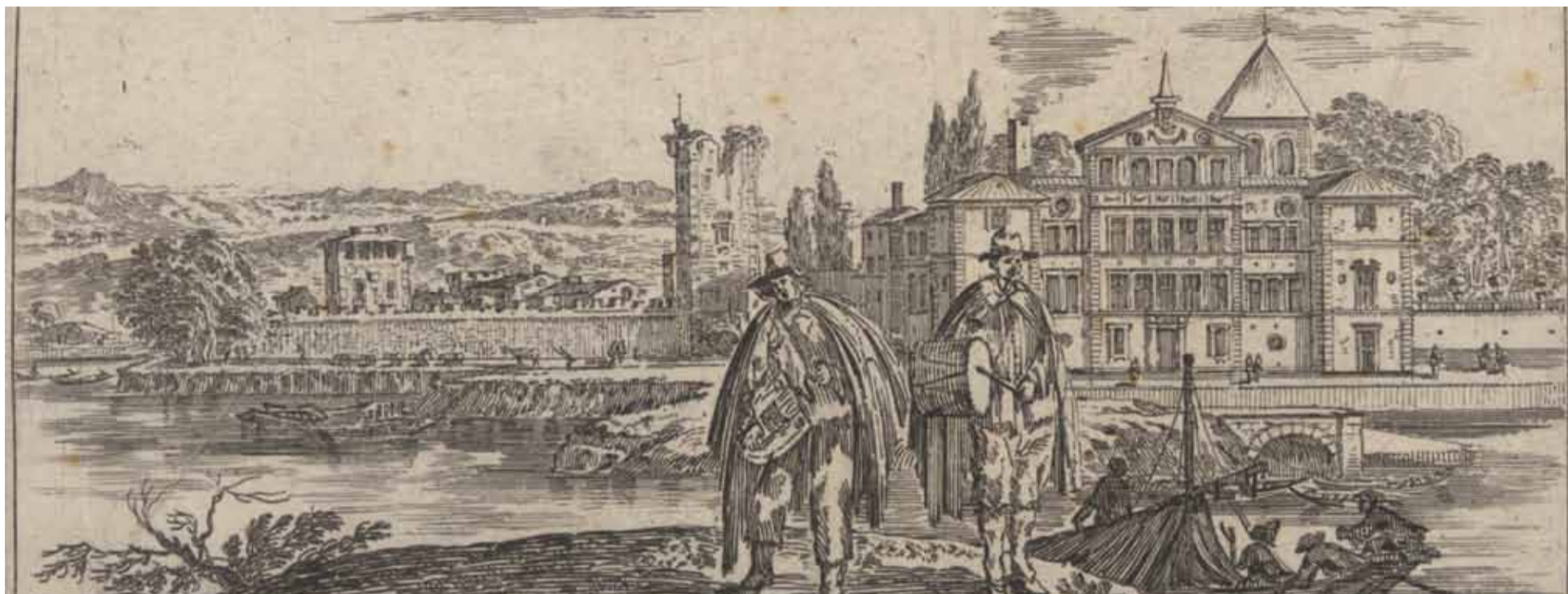
Maison de Vimy près de Lyon, résidence de la famille de Neuville de Villeroy, actuellement Neuville sur Saône, gravure, Israël Silvestre, 17 e s., Inv. 46.434