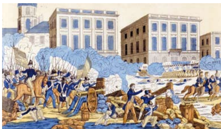
Événements de Lyon (9, 10, 11, 12, 13 avril 1834), gravure, Dembour et Gangel, 1834, Inv. 54.457