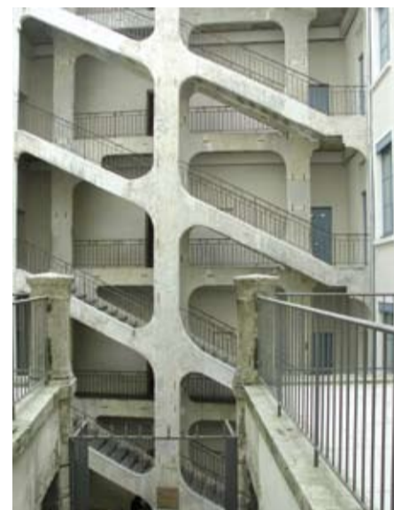
Cour des Voraces, traboule des pentes de la Croix-Rousse célèbre pour son escalier monumental à volées libres, construite en 1840 dans le style canut, refuge des canuts lors de leurs révoltes et siège de combats en 1849, photographie, 20 e s.

En avril 1835, à Paris, 163 insurgés faits prisonniers sont jugés au cours d'un procès qualifié de “monstre” : ils sont condamnés à la déportation ou à de lourdes peines de prison. Selon Y. Lequin, un amalgame, dans les consciences, entre canuts et républicains daterait de ce procès, dû à l'époque politiquement trouble des débuts de la monarchie de Juillet (1830-1848).