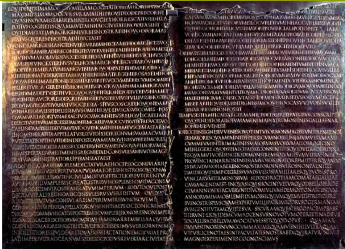
Tables claudiennes, plaque de bronze, musée de la civilisation gallo-romaine, © Ch. Thioc, Musée gallo-romain de Lyon, Département du Rhône

la magistrature publique de Rome... discours immortalisé par une table de bronze affichée placée dans le sanctuaire des Trois Gaules : les fameuses Tables Claudiennes*.