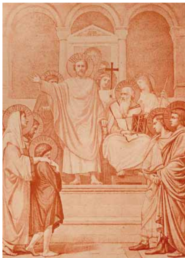
Les Saints martyrs de l'Église de Lyon, héliogravure à la sanguine, d'après Dujardin, imprimeur J. Saillard, Inv. N 3426.2

Pour commémorer le martyre et ce miracle, très tôt au moyen âge et jusqu'au 14 e s., on célèbre en juin le jour des Miracles, dit tardivement fête des Merveilles : une procession emprunte la voie de terre puis de grands bateaux sur la Saône, entourés d'une flottille de Lyonnais, pour suivre un itinéraire complexe qui se termine par une messe solennelle à Saint-Nizier.