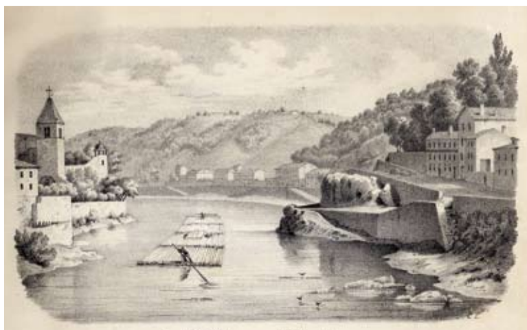
Vue de l'île Barbe, avenue du Midi, près de Lyon, radelier sur la Saône, lithographie, C. Lang, vers 1855, Inv. 55.45.6