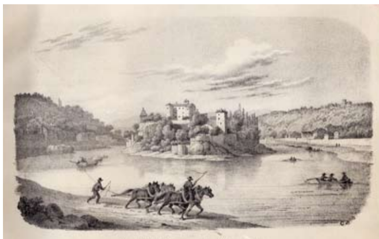
Vue de l'île Barbe, avenue du nord, près de Lyon, halage d'une embarcation sur la Saône, lithographie, C. Lang, Inv. 55.45.15

Au 19 e s., le Rhône fourmille de travailleurs. Sur les berges, les hâleurs , très nombreux, aident à remorquer les bateaux des mariniers pour remonter le fleuve lors des passages délicats. À quai, les crocheteurs se chargent des chargements et déchargements, utilisant leur crochet pour déplacer les ballots de marchandises. Sur l'eau, les radeliers rassemblent et convoient par flottage des troncs d'arbre pour les chantiers navals. Ils croisent les passeurs , qui embarquent des passagers sur leurs bacs pour traverser le fleuve. Sur des bateaux en bois accostés, les meuniers tirent profit de la force hydraulique pour produire la farine des Lyonnais, changeant d'accostage quand baisse le niveau des eaux. Enfin, sur la rive, lavandières et plattières lavent le linge sur des bateaux lavoirs, les "plattes" équipées de chaudières pour faire bouillir le linge.