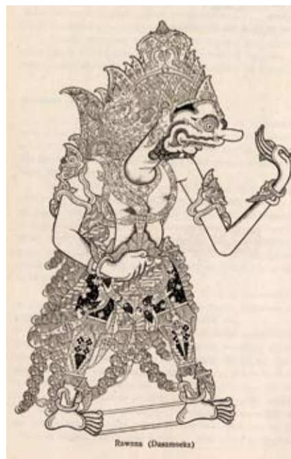
Rawana (Ravana), Het Javaansche tooneel, lithogravure, J. Kats, 1923, Inv. 50.236