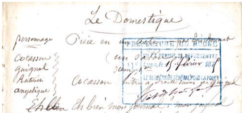
Détail du manuscrit, Le domestique de Pierre Rousset, avec la cachet de la Préfecture, 1872-75, Inv. 006.8.3.5

Les premières traces de mise par écrit du répertoire apparaissent sous le second Empire : en 1852, les esprits sont encore marqués par les révoltes lyonnaises. Les ouvriers lyonnais... et le succès de Guignol, font peur, ce qui se traduit par le contrôle des lieux de réunions publiques et des théâtres.