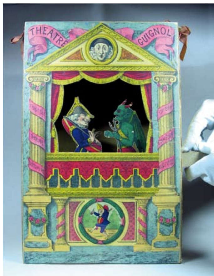
Théâtre Guignol, théâtre de papier, B. Coudert, 19 e s., France, Collection Dor

(Notice du nouveau théâtre portatif à rainures de P. Clerc)