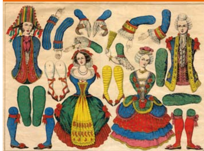
Pantins - Marquis et marquise, planche d'images de la fabrique Pellerin, Épinal

Bien souvent, les planches de décors de l'Imagerie Pellegrin représentent des constantes - le Palais, la Marine, la Campagne - ou des lieux identifiés de la ville d'Épinal - la prison, la caserne.