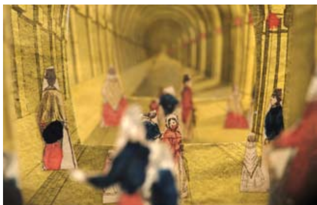
Histoire du tunnel sous la Tamise, scène de théâtre de papier représentant une visite sous le tunnel construit entre 1824 et 1844 par Sir Isambard Marc Brunel, vers 1850, Londres

Au 18 e s., c'est pour que les plaisirs du théâtre se poursuivent après la représentation que l'on vend aux spectateurs des planches imprimées sur lesquelles figurent les acteurs qu'ils viennent de voir sur scène.