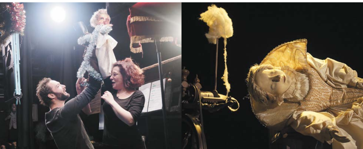
Guignol et les quarante couverts, DR.

Le musée des arts de la marionnette offre de nombreux liens avec le français, l'histoire-géographie, les arts plastiques et la technologie, notamment par la thématique culture et création artistiques.