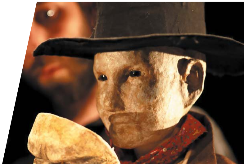
Buffalo Boy, Cie L'Ateuchus, création automne 2018 au TNG