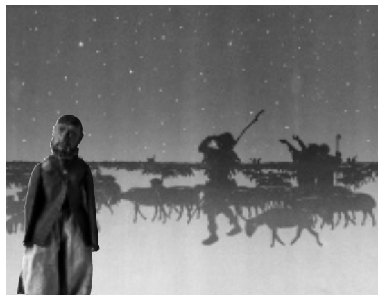
• Bergers (marionnettes d'ombre sur socle), France • Inv. 54.243

D'autres sont fichées dans un socle que le marionnettiste déplace (des marionnettes d'ombre sur socle* ).