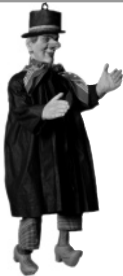
• • • Tchanchès (marionnette à tringle) Belgique • • • Inv. N 447