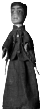
• Guignol (marionnette à gaine) France • Inv. 49.47