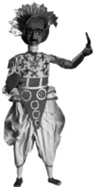
• • • danseur indien • • • (marionnette à fils) • • • marionnette foraine, • • • France, Inv. 79.4.7

C ette fiche donne des éléments de définition sur les différentes techniques de manipulation, les dispositifs scéniques, les marionnettistes, ou les accessoires. Le musée possède une majorité de ces types de marionnettes ; celles qui font partie des collections sont indiquées par un *.