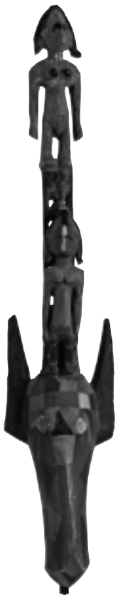
• Antilope (marionnette • castelet) sogo, Mali • Inv. 81.4.2