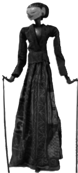
• Princesse (marionnette à tiges) wayang golek, Java • Inv. 47.155

Le marionnettiste est tout entier dans le corps de la marionnette dont il supporte le poids à l'aide d'une grande tige fixée sur son dos et/ou sa tête. Pour la marionnette-castelet, il tient la grande tige à deux mains.