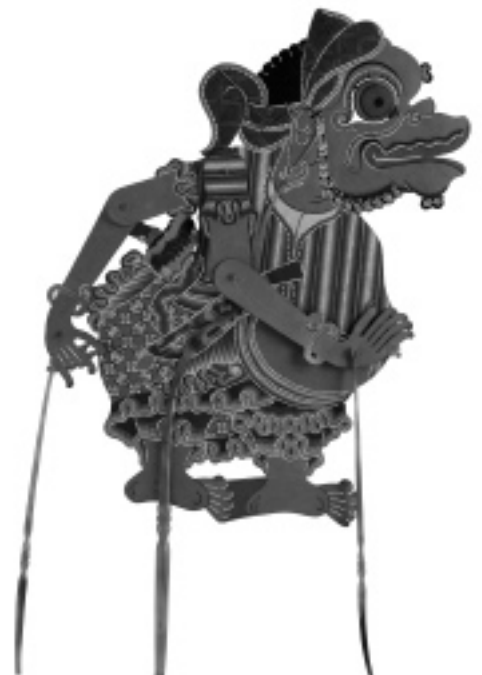
• Togog (marionnette d'ombre sur tiges) • wayang kulit, Java • Inv. D ATP 56.1.1368

GAMELAN : orchestre accompagnant le jeu de marionnettes indonésiennes.